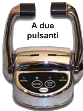
A due pulsanti