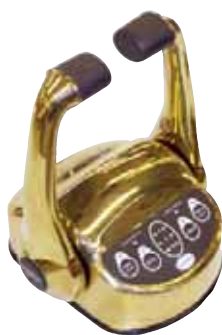
DORATA (a richiesta)