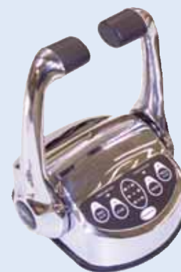
Modulo di comando modello CH2001