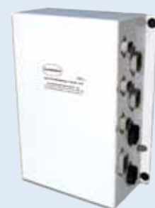
Processore di riserva cambio-acceleratore