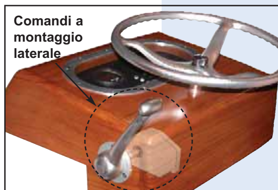
Comandi a montaggio laterale

Glendinning progetta e costruisce prodotti di qualità per il settore nautico. Da oltre 30 anni i nostri prodotti sono noti per la qualità, l'affidabilità e il valore che dura nel tempo. Scoprire le ragioni del nostro motto "Rilassatevi . . . siamo a bordo!"