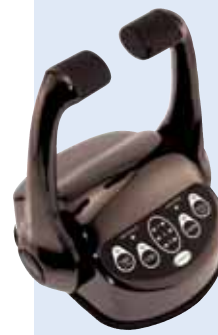
NERA (a richiesta)