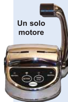
Un solo motore