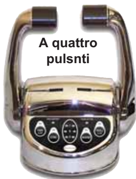
A quattro pulsanti