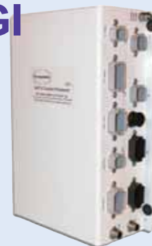
Processore di comando modello EEC3

Ingresso a doppia batteria — Una delle esigenze più importanti per qualsiasi comando elettronico di un motore è l'alimentazione da batteria. Il processore di comando Glendinning EEC3 è in grado di essere alimentato da due batterie separate, per assicurare che il funzionamento del sistema di comando non possa mai interrompersi.