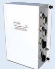
Back-upprocessor voor transmissie- gasklep