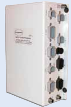
Controleprocessor Model EEC3

Dubbele accu-ingangen — een van de belangrijkste eisen die aan elektronische motorcontrolesystemen wordt gesteld, is accuvermogen. De EEC3-controleprocessor van Glendinning kan met twee verschillende accu's worden gevoed. Dit waarborgt dat het controlesysteem nooit kan uitvallen.