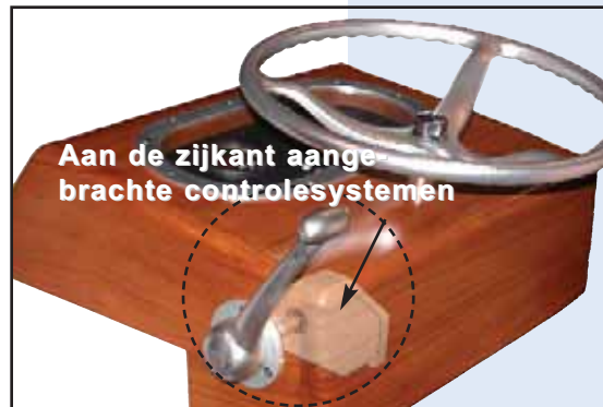
Aan de zijkant aangebrachte controlesystemen

Glendinning ontwerpt en vervaardigt kwaliteitsproducten voor de zeevaart. In ruim 30 jaar hebben we onze reputatie gevestigd als een bedrijf dat hoogwaardige, betrouwbare producten van blijvende waarde levert. Ontdek waarom we zeggen: "Ontspan u ... we varen met u mee!"