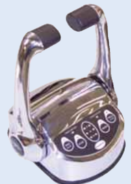
Hoofdstation Model CH201